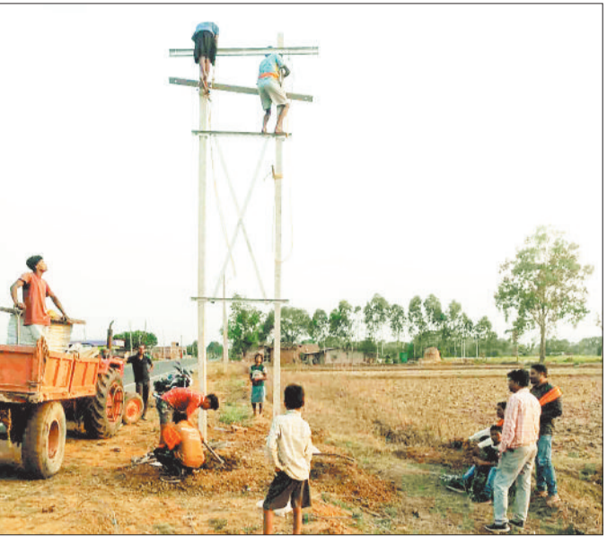
विद्युत लाइन का विस्तार करते कर्मचारी।।

विद्युत अमला व उपभोक्ताओं के लिए बड़ी समस्या साबित हो रही दशकों पुरानी जर्जर विद्युत लाइन से अब मुक्ति मिलने वाली है। शासन ने पुरानी विद्युत लाइन को बदलने के लिए 220 करोड़ की स्वीकृति प्रदान की है। विभाग खुले तारों वाली विद्युत लाइन को हटाकर केबल लगा रहा है। योजना के तहत विद्युत अवरोधों के नियंत्रण के लिए विद्युत फीडर की लंबाई कम करने के साथ ही अन्य समस्याओं का भी निराकरण किया जा रहा है। शहर सहित पूरे सरगुजा जिले में 80 के दशक में विद्युत का विस्तार किया गया था। तत्कालीन आवश्यकताओं को देखते हुए लम्बी-लम्बी लाइन खींचकर बड़े इलाके में विद्युत विस्तार किया गया था। दशकों पुरानी विद्युत लाइन के जर्जर एवं अव्यवहारिक होने के कारण आए दिन समस्या हो रही थी। तब बड़ी आबादी तक विद्युत पहुंचाने लम्बे-लम्बे फीडर बनाए गए थे तथा एक ही फीडर में कृषि, व्यवसायिक एवं घरेलू उपभोक्ताओं को जोड़ा गया था। कृषि क्षेत्र के उपभोक्ताओं में विद्युत खपत बढ़ने के कारण विद्युत लाइन व ट्रांसफार्मर खराब हो जाते हैं। लम्बे फीडर में खराबी ढूँढने विद्युत कर्मियों को कड़ी मशकत करनी पड़ती है तथा सुधार कार्य में भी काफी समय लगता है। हुकिंग के माध्यम से बिजली चोरी की भी समस्याएं लगातार बढ़ती जा रही है। स्थिति को देखते हुए लम्बे समय से विद्युत लाइन के जर्जर तारों को बदलने के साथ ही अन्य तकनीकों बदलाव करने की आवश्यकता लम्बे समय से महसूस की जा रही थी। विद्युत उपभोक्ताओं की समस्याओं को देखते हुए शासन ने इस